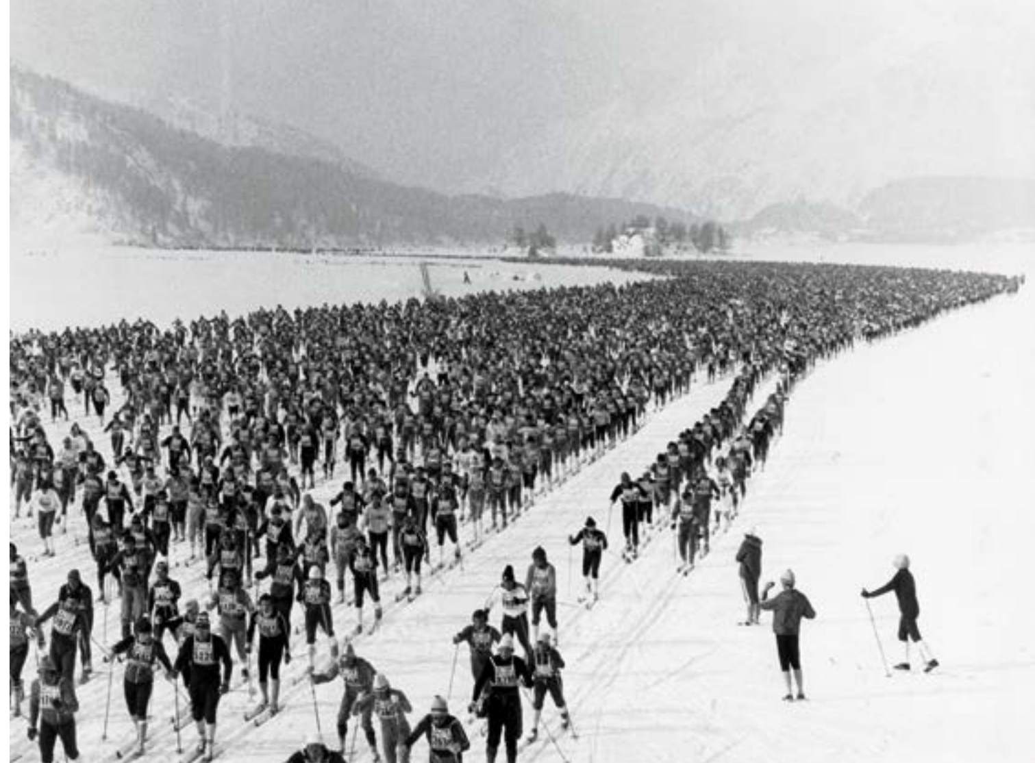
Beim 8. Engadin Skimarathon 1976 liefen die gegen 10 000 Teilnehmer noch brav in der Spur. Drei Jahre später waren die Spitzenleute bereits im Skatingstil unterwegs.

Ausgerechnet in Russland erfuhren die Ski eine andere Verwendung als die wettkämpferisch ausgerichtete des Westens. Bezeichnenderweise nach der kommunistischen Oktoberrevolution wurden sie als «Quelle der Gesundheit» für die proletarischen Massen gepriesen. Damals wurden Volksläufe durchgeführt, die neben der gesundheitlichen Fitness der Teilnehmer auch die Grösse und Schönheit der